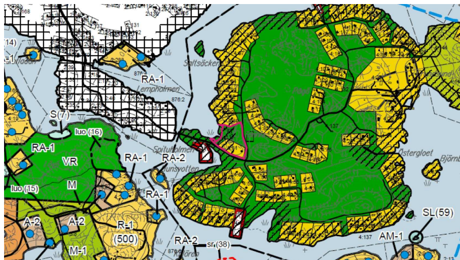
Utdrag ur östra skärgårdens generalplan. Planeringsområdet markerat med röd linje

På området gäller delgeneralplanen för Ekenäs östra skärgård som är godkänd 3.11.2008 och fått lagakraft 2009. Området har i delgeneralplanen noterats som område med gällande stranddetaljplan.